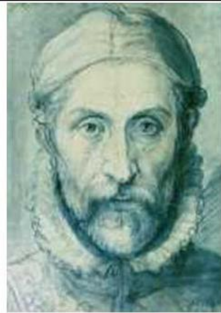
Giuseppe Arcimboldo 1527-1593